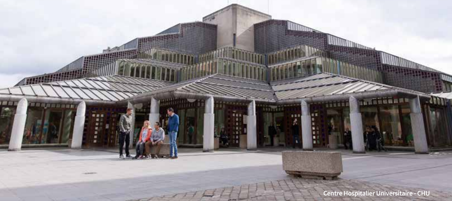
Centre Hospitalier Universitaire - CHU